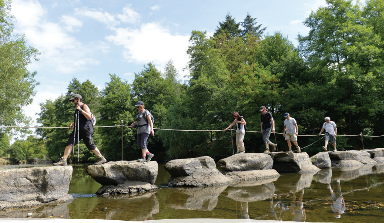
Gué de Vernoux – Gourgé