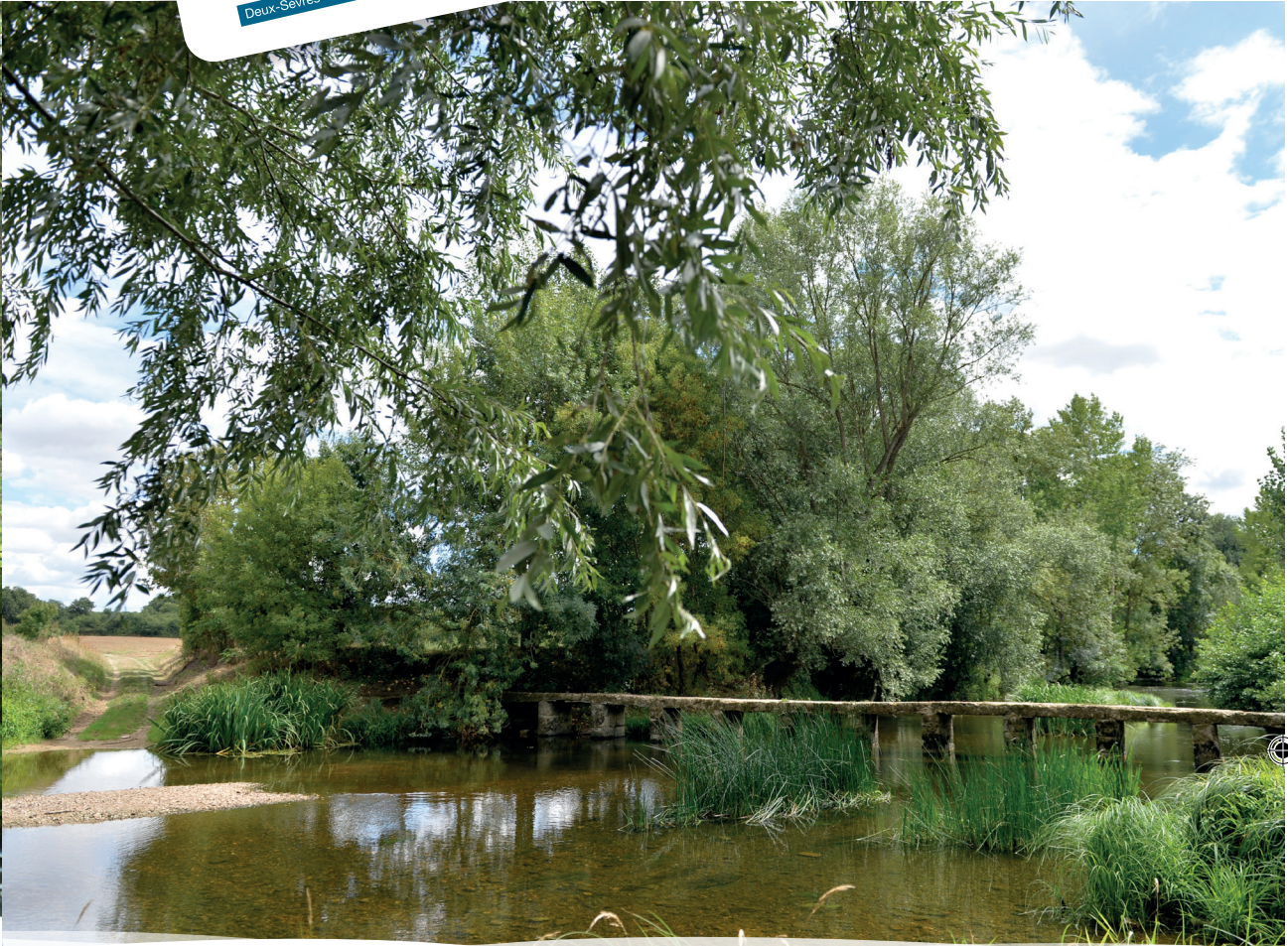
© Darri - SMVT - Le Thouet à Argentine - Saint-Généroux (79)