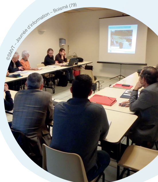
Journée d'information - Boismé (79)

Cette journée d'information a permis de présenter des actions du territoire visant à améliorer le bon état des eaux et ainsi répondre aux objectifs de la Directive Cadre Européenne sur l'Eau.