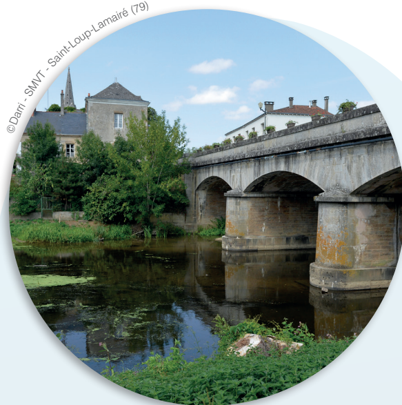
© Darri - SMVT - Saint-Loup-Lamairé (79)

Ce groupe de travail composé d'élus, d'usagers, des services de l'État et d'experts techniques, définit actuellement le linéaire du réseau hydrographique pouvant être considéré comme cours d'eau. Ce travail doit aboutir à une cartographie évolutive qui sera complétée au fur et à mesure de l'acquisition de connaissances.