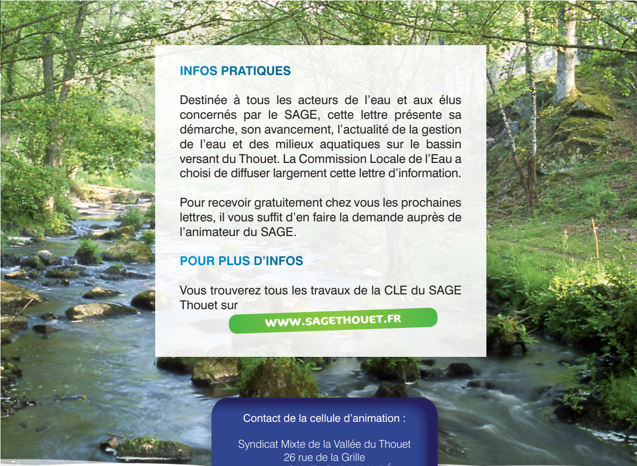
© Baudry - SMVT - Thouet amont