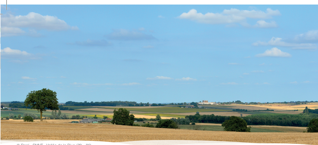
© Darri - SMVT - Vallée de la Dive (79 – 86)